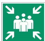
Пункт (место) сбора

5.4. В случае пожара прозвучит сигнал пожарной тревоги. Услышав оповещение, без промедления покинуть здание по обозначенному эвакуационному пути. Спускаться только по лестнице, не использовать лифт. Следовать за Представителем Оператора к месту сбора при эвакуации.