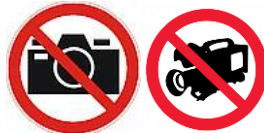
Фото- и видеосъемка запрещены!

4.5.3. производить фото- и видеосъемку объектов, сооружений порта, проводимых работ, а также прилегающей инфраструктуры без разрешительных документов.